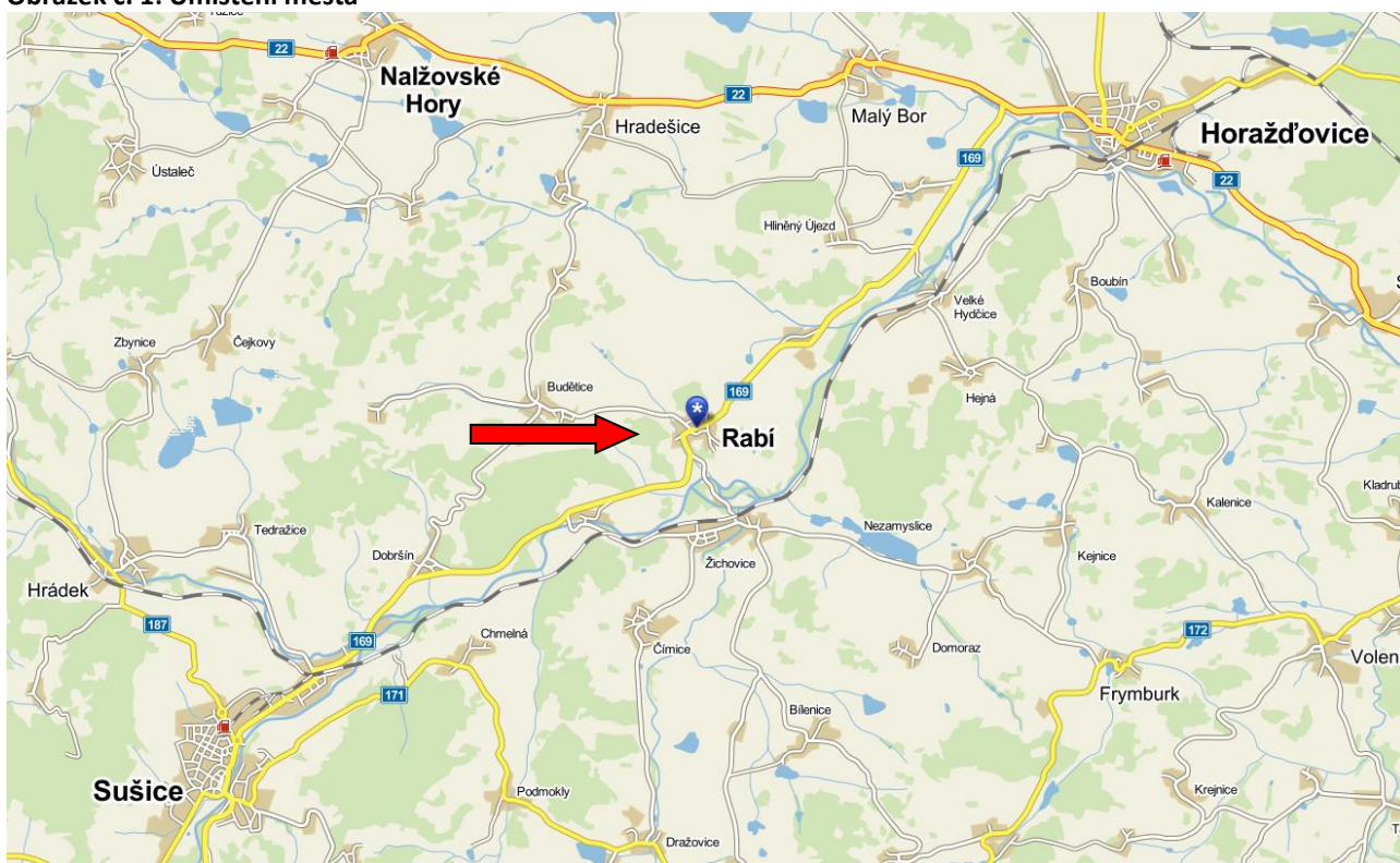
Obrázek č. 1: Umístění města

Město má zpracovaný a schválený nový územní plán od roku 2022.