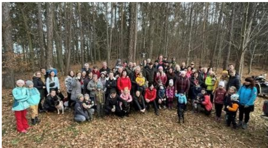
... a potkali jsme se jak s Dobršínskými, tak s Budětickými.