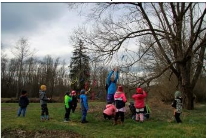
Morana dětem nechala u Otavy vzkaz.

„Zimo, zimo, táhni pryč, nebo na tě vezmu bič“