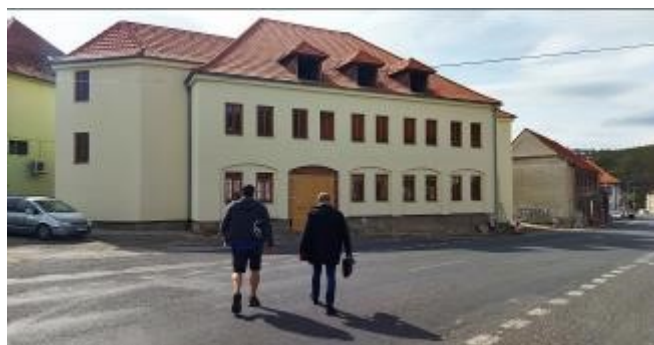
Z venku vypadá dům už přívětivě, uvnitř jde ale stále o hrubou stavbu.

lizaci stomatologických ordinací, zejména ve Švédsku a Norsku. Proto by ráda tuto zkušenost přenesla i sem. „Lékaře ale nemáme nasmlouvané. Neděláme to pro nikoho konkrétního,“ přiznává majitel objektu, že jde zatím spíše o