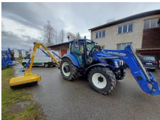
Prostřednictvím Svazku obcí Pošumaví a dotace Plzeňského kraje můžeme od jara využívat nové příkopové rameno.