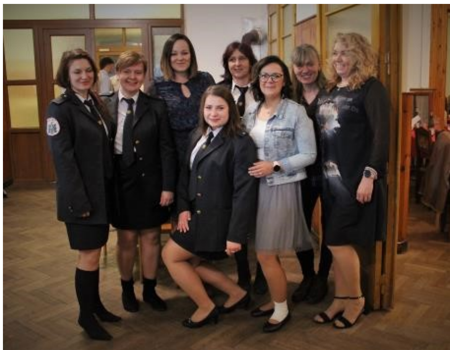
Rábské hasičky a dobrovolnice z ROSy připravily do tomboly 19 dortů a nepoččet rumových koulí.

Ještě si odskočím umýt ruce a nůž odkládám vedle podkovy. Za půl minuty je fuč. První poučení—příště s sebou vlastní silikonovou stěrku, příborový nůž a polévkovou lžici.