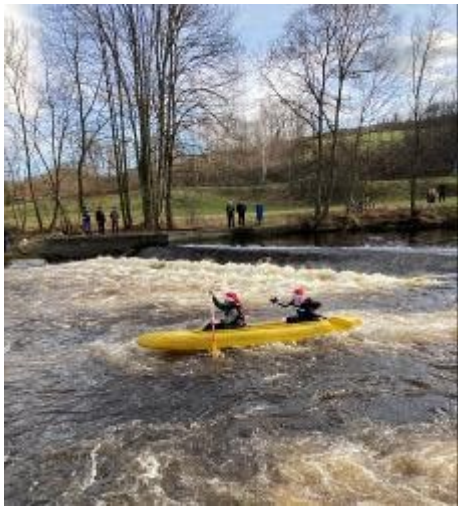
Vánoční splouvání Otavy.

Už dlouho jsme v Rábských novinách o Vánocích nepsali. Posledních pár let totiž toto periodikum vycházelo vždycky těsně před těmito svátky, takže psát v předvánočním vydání o loňských svátcích vůbec nedávalo smysl. Proto teď s velkou radostí o tomto krásném čase napíši pár řádek.