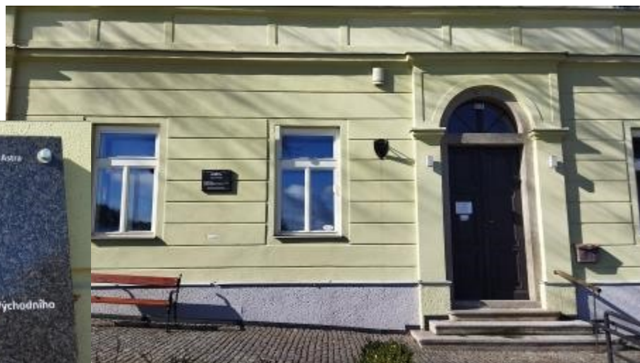
Na budově bývalé rábské školy byla 6. července 2012 odhalena pamětní deska.