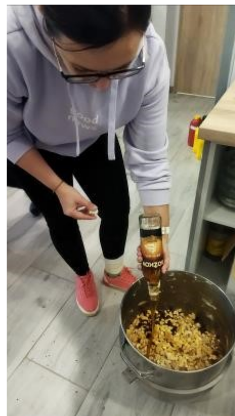
Kromě dortů se do tomboly vyráběly i rumové koule.