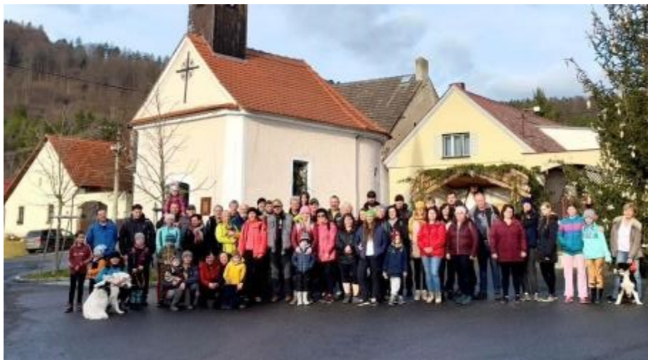
Na silvestrovský výšlap vyrazilo 67 lidí...

Další akcí bývá na Štěpána Splouvání Otavy s Lubošem Brabcem. Jako vždycky ze Sušice k nám do Čepic. Letos se zúčastnilo osmnáct lodí. Trochu menší počet, pravděpodobně z důvodu vyšší hladiny