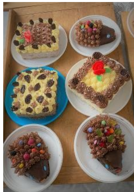
Nechyběly ani dorty ve tvaru ježka.