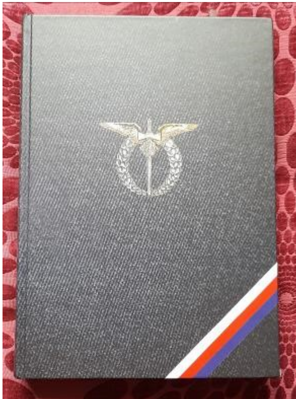
Nová kniha v rábské knihovně Za křídly... Válečné osudy letců z Plzeňského kraje bojujících v RAF .