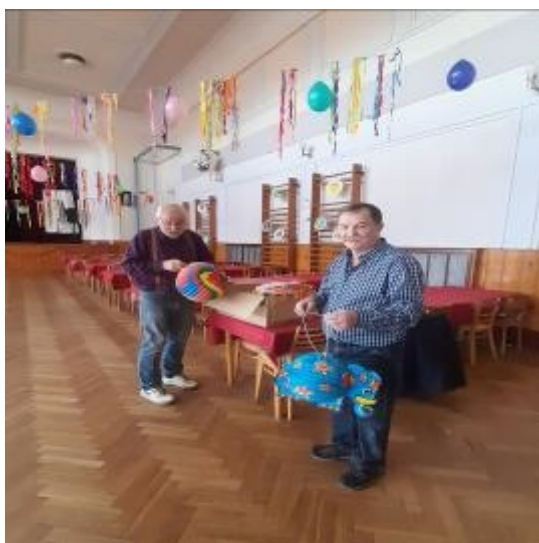
Letos si ROSa dala s výzdobou opravdu práci. Každý krepák přivázali, čímž trochu zklamali dětské všetečné ručičky.