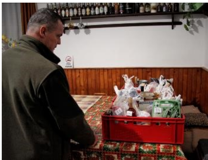
Celkem bylo v tombole 225 cen

Fotogalerie z přípravy plesu na fb město Rabí bit.ly/Cepiceples2023