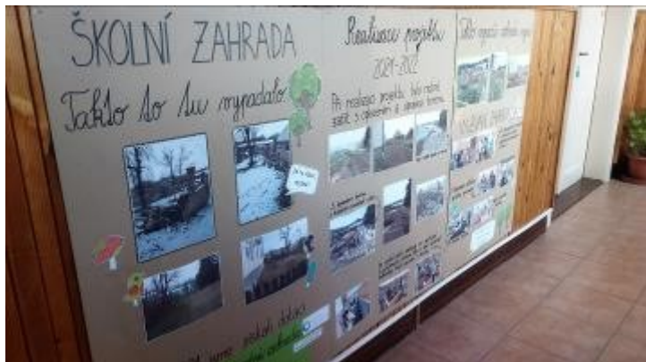
Letošní školní rok škola zahájila slavnostním otevřením školní zahrady.