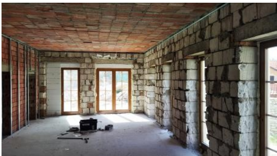
V přízemí bude kavárna s vlastní pražírnou.

Na to, kdo si nakonec byty koupí nebo pronajme, si budeme muset ještě nějakou chvíli počkat. Jestli zde budou žít na stálo, nebo sem budou jenom jezdit na rekreaci, teprve uvidíme. Každopádně obec by nové Rábské uvítala.