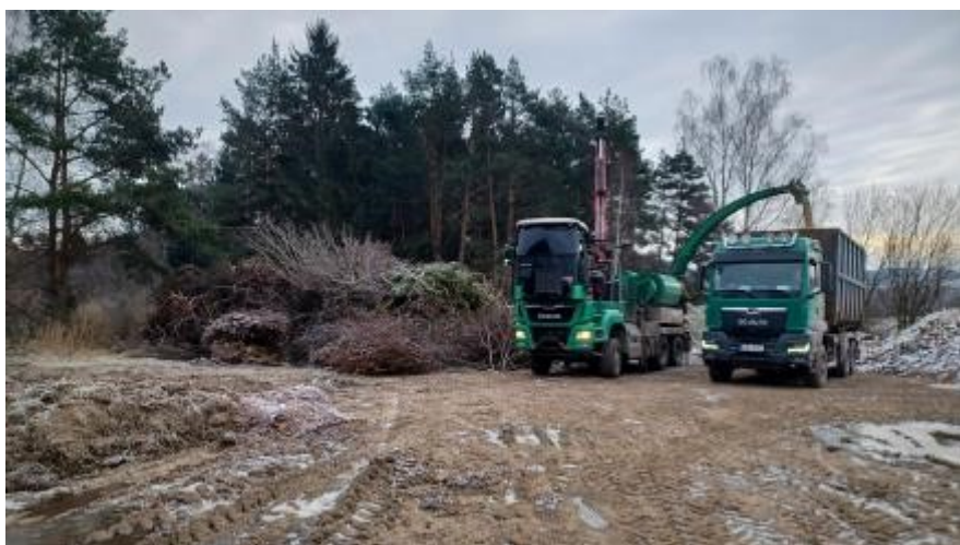
Na začátku února přijela štěpovačka z Písecké lesní a dřevní hmotu nadrtila a odvezla. Objednáváme jí dvakrát ročně. Nic za hmotu nedostáváme, ale nic nás její likvidace nestojí. Do venkovního skladu na Žínku mohou odkládat větve i občané. Stačí si vyzvednout klíče na radnici. Do budoucna plánujeme poříditi do obcí i kontejnery na větve, které do kompostu nepatří.