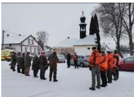
V noci z pátku na honební sobotu po dlouhé době hustě nasněžilo.