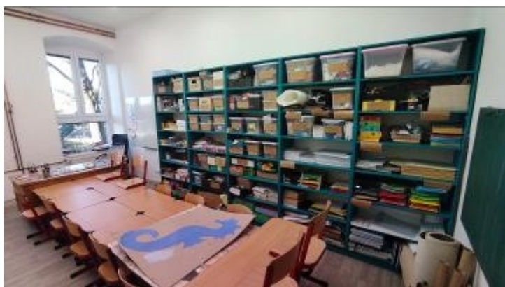
Novinkou nedávné doby je rozšíření prostor školy o bývalý byt. Tím škola získala sborovnu, ale také tuto úžasnou učebnu VV a pracovních činností.