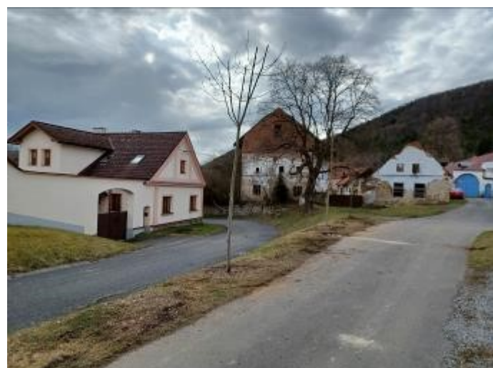
... a v Čepicích došlo k pokácení nebezpečného topolu v prostoru vodáckého občerstvení a k výsadbě nových listnáčů, kteří nahradili nevhodné a z dopravního hlediska nebezpečné tůje.