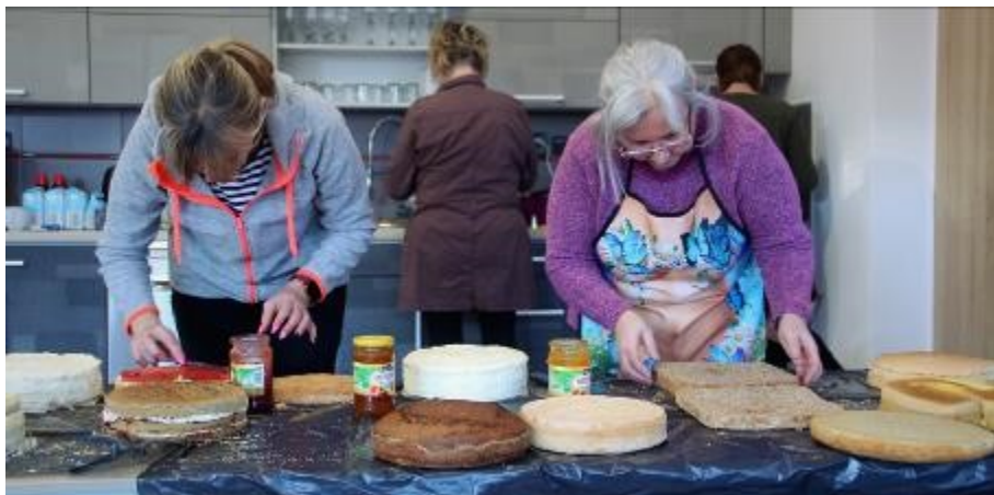
Celá hasičárna pro proměnila v cukrářskou dílnu.

ale zdobit je? Navíc když mají dělat parádu v tombole. Každý, kdo mě zná, ví, že kuchyň je mé nepřátelské území. „Pomocnou ruku raději nechtěj. To by bylo víc škody než užitku,“ braním se. „Taky to bude pro mě poprvé. Budou tam zkušené cukrářky, určitě to od nich pochyťme,“ povzbuzuje mě Jana.