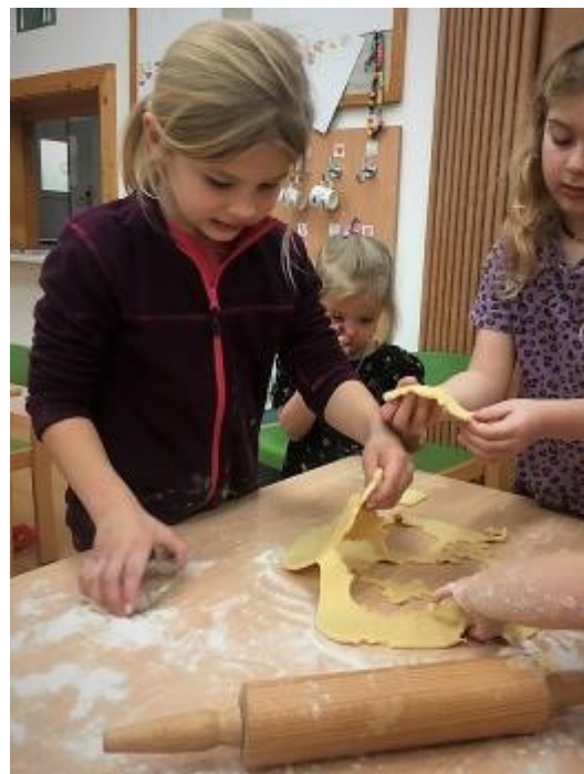
Už pekly hnětýnky nebo štrůdl nebo vyráběly pečený čaj.

binářích. Většinou si každá učitelka hledá takovou aktivitu, aby ladila s tématem týdne. A když nejde najít tematický hokus pokus, tak se peče. Dělalí jsme cukroví, perníčky, hnětýnky, palačinky, sirupy. Když jsme měli přebytek ovoce ze zahrady, udělali jsme zapečený čaj.