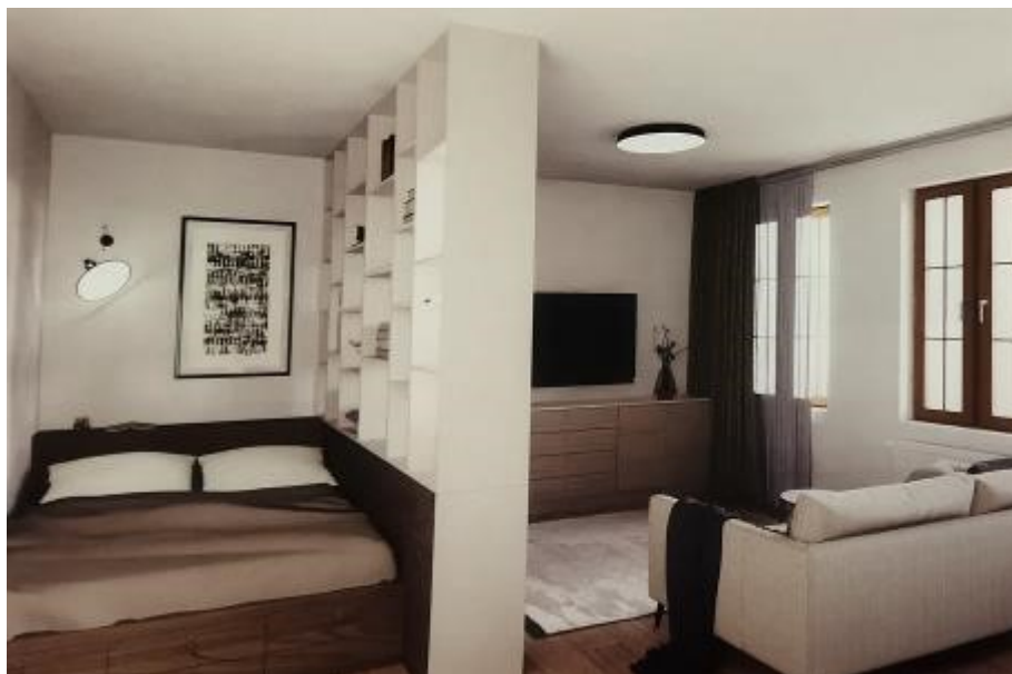
Byty budou nabízené v zařízené podobě.