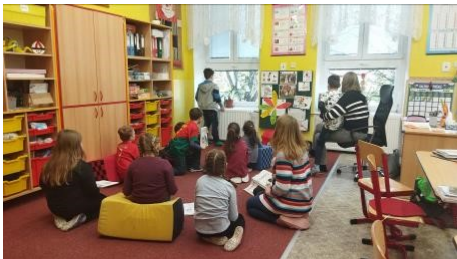
Druhá třída vyhlíží na novou školní zahradu s altánem.

Díky početnému pedagogickému sboru mohou třídy často během výuky dělit. „Několikrát týdně to vychází na 7-8 žáků ve skupině. Logicky se tak může