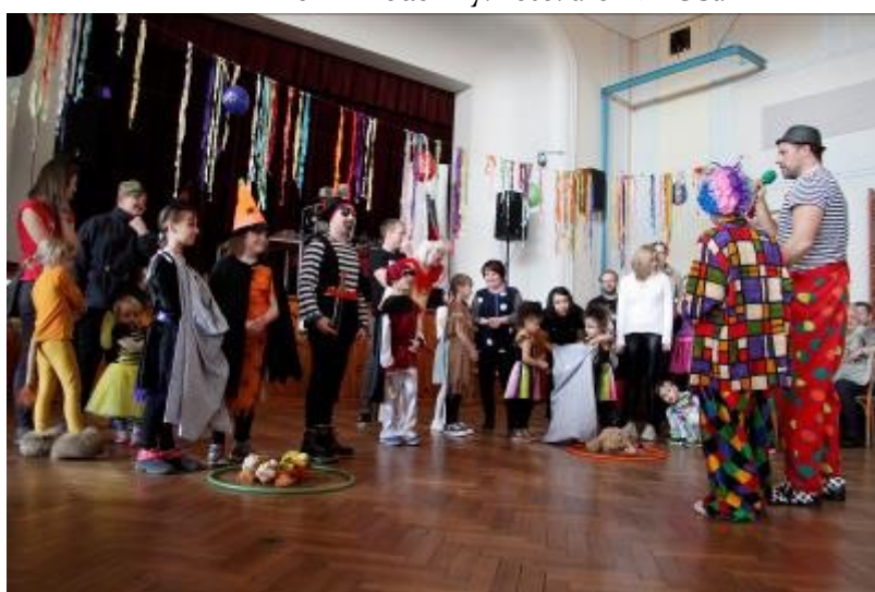
ROSa si nachystala i spoustu her. Nechyběly obruče, přetahovaná nebo závod rodičů s dětmi v dece.

Celá fotogalerie ke shlédnutí na fb města Rabí bit.ly/Rabikarneval2023