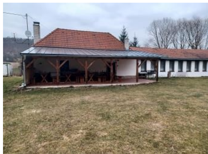
Díky pojistce jsme mohli opravit přístřešek u hasičské klubovny v Čepicích, který byl poškozen loňskou supercelou.