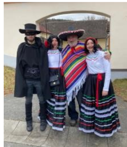
Zavítala i návštěva z Mexika.

A koho jste mohli v našem průvodu potkat? Nechyběla klasika jako vodníci, kominíci, dřevorubci, medvěd s medvěďákem, spousta jiných zvířat a zvířátek, král a královna, princové a princezny, rytíři, uklízečka, babka, pionýrka, cikánky, doktor se sestrou, vězň, upíří. K nim se přidali Rumcajs, teroristi z východu, hippies, mnoho-