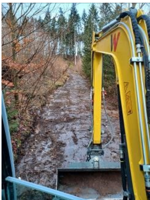
V lednu jsme také opravili lesní cestu u Čepic.