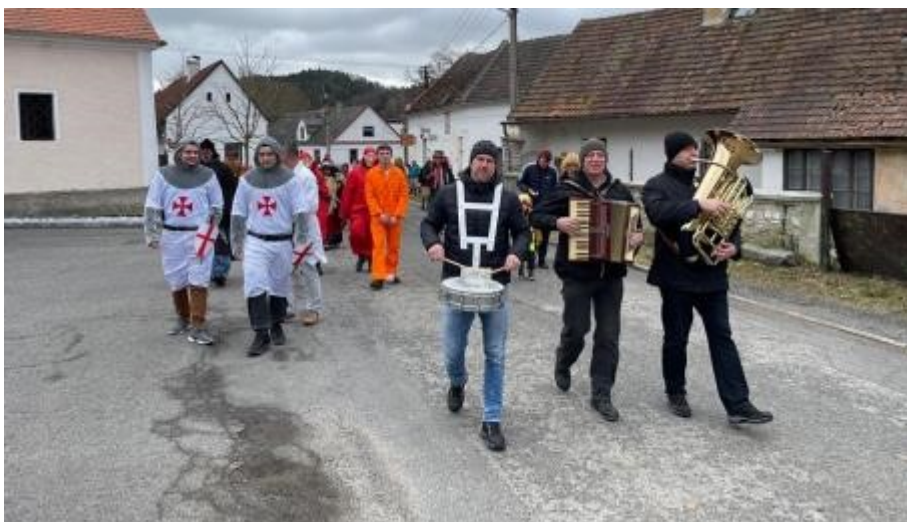
Masopustní průvod procházel celou vsí od 11:00 do téměř čtyř hodin odpoledne.