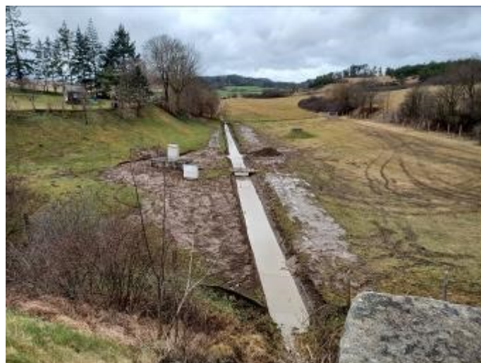
První týden v roce jsme odbahnili a upravili lokalitu u vrtů v Rabí směrem na Budějovice.