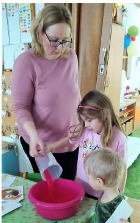
Oblíbená školková aktivita—hokusy pokusy.