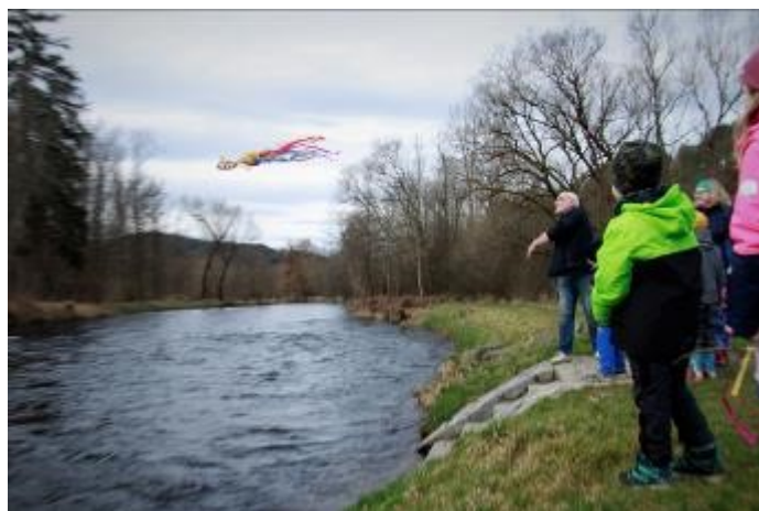
A letěla a letěla daleko, předaleko. Jako by jí vrhl sám Jan Železný.