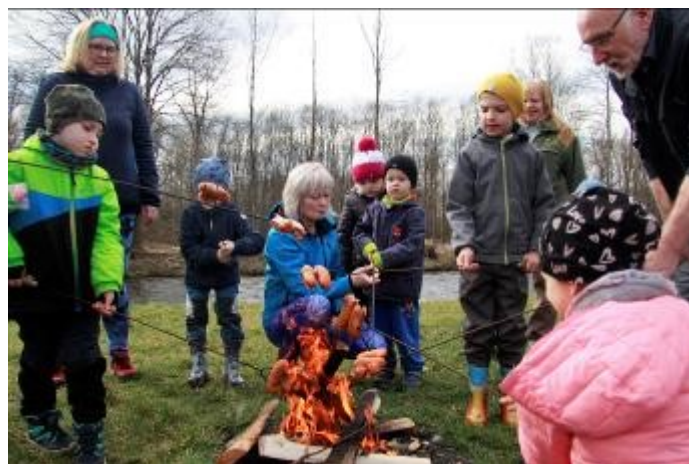
Za odměnu si každý opekl špekáček. A děti dostaly i melounové lízátko.

Celá fotogalerie ke shlédnutí na fb města rabí bit.ly/MSRabiMorana2023