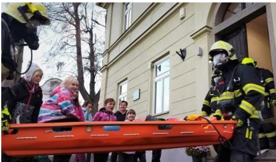
V listopadu 2022 se mladí hasiči a hasičky zúčastnili cvičení výjezdovky jak zachránit lidi z hořícího domu.

za nasazení. „Dík patří všem klukům, kteří se výjezdů a cvičení zúčastňují na úkor vlastního volna. A samozřejmě manželkám a přítelkyním, které nám tuto naši úchytku pro hasiče tolerují,“ uzavřel velitel.