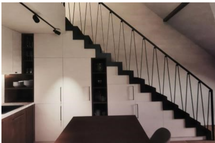
Podkrovní mezonety, které budou čtyři, budou nabízet i vestavěné úložné prostory

vizi. „V úvahu přichází také ambulance obvodního lékaře-nebo fyzioterapie. Variant může být více,“ dodává.