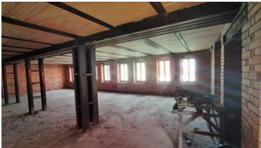
V prvním patře vznikne 9 bytů, z toho jeden s terasou do dvora.

Z venku už dům vypadá obyvatelně, ale zevnitř jde stále o hrubou stavbu. Proto není ještě možné byty dohledat v nabídce, i když zájem už o ně podle investora je. „Už se u nás byli informovat dva mladí lidé ze Sušicka, jestli by si mohli rezervovat byt. Ale ještě je na domě hodně práce.“ To potvrzuje i starosta Rabí Miroslav Kraucher, na kterého se také již obrátili místní s dotazem ohledně koupě bytu.