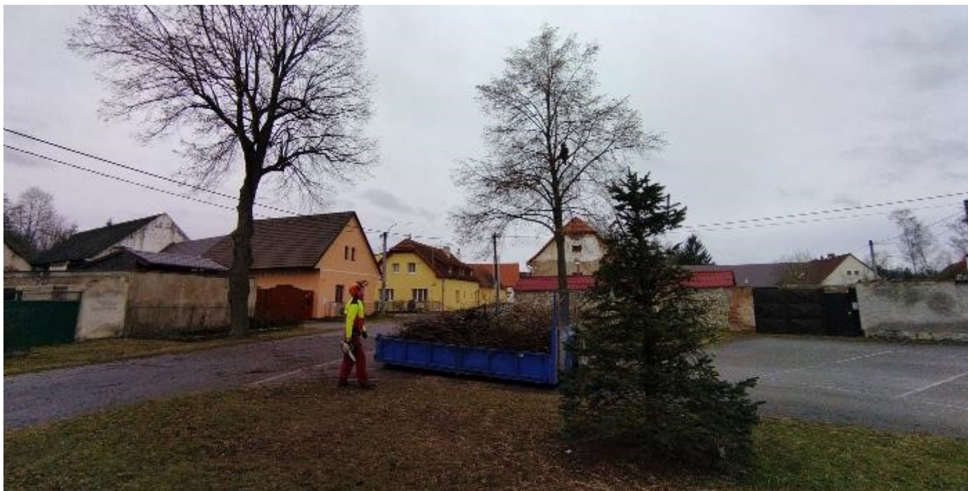
Období vegetačního klidu jsme využili k údržbě našich stromů. V Bojanovicích došlo k prořezávce lip na návsi...