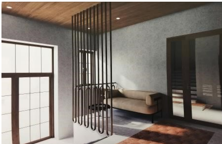
Dominantou vstupní haly bude dub a ohýbané trubky mosazné barvy. Foto: ConTree Concept