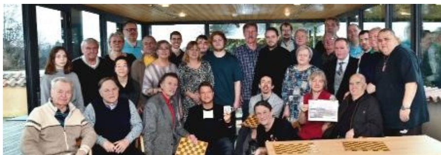
Účastníci turnaje na Pražském hradě.

Ano, již před tolika lety jsem zorganizoval propagační turnaj v české dámě s cílem zviditelnit tuto krásnou deskovou kombinační hru v Pošumaví. A po nesmělém první ročníku, který se hrál na rabském a velhartickém hradě s osmi hráči, se stal velmi populární a lákal stále více hráčů z celé republiky. Navštívili jsme mimo jiné Klenovou, Strakonice, Blatnou, Švihov. Hráli jsme na Svatoboru, Korábu, Hrádku, v Mlázovech, Hnačově i slavné Zelené Hoře u Nepomuku, až vše vygradovalo ve velké finále přímo na Pražském hradě.