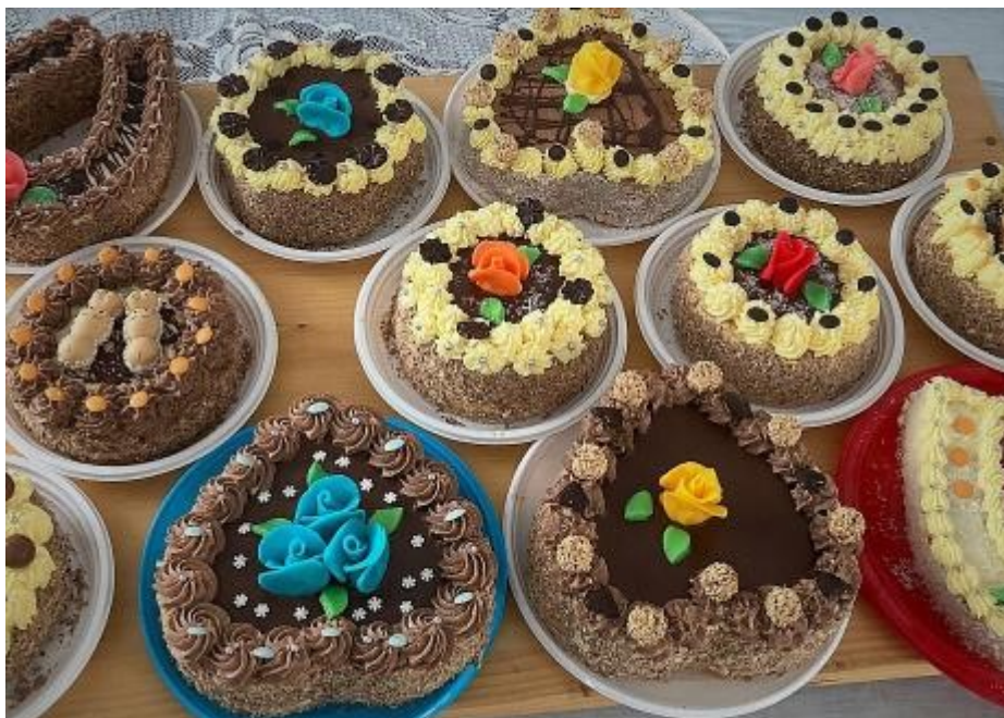
Domácích dortů bylo v tombole celkem třicet.

Po dvouleté covidové pauze jsme se opět, a strašně rádi, chopili zorganizování oblíbeného hasičského bálu. Ten jsme naplánovali na 18. března 2023. Zajistit vše tak, aby se povedl a dlouho na něj vzpomínalo, dá trochu práce.