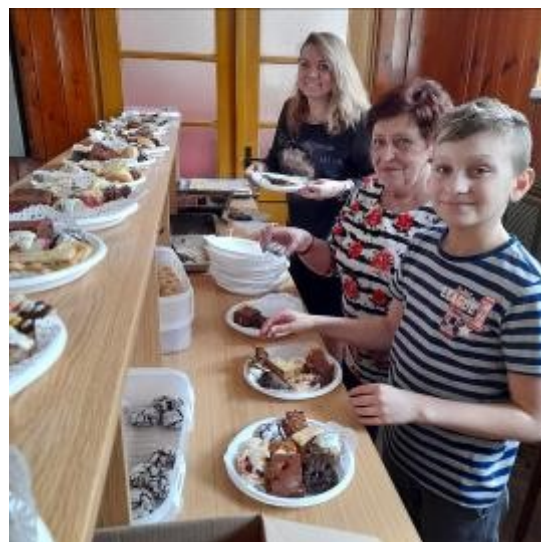
Karneval připravil Rábský okrašlovací spolek ROSa. Majstrštykem byly tácky s domácími moučníky.