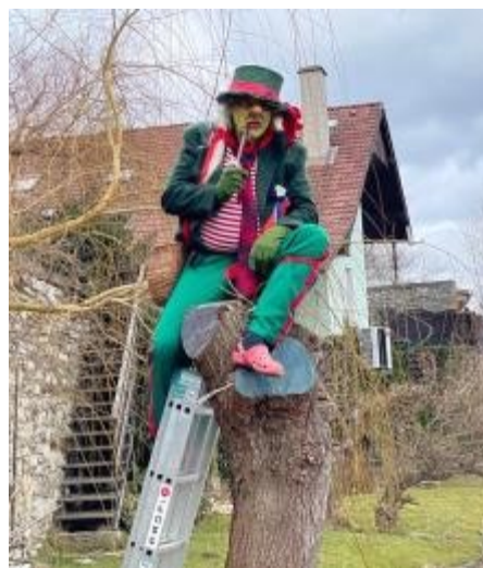
Vodník nemohl chybět.