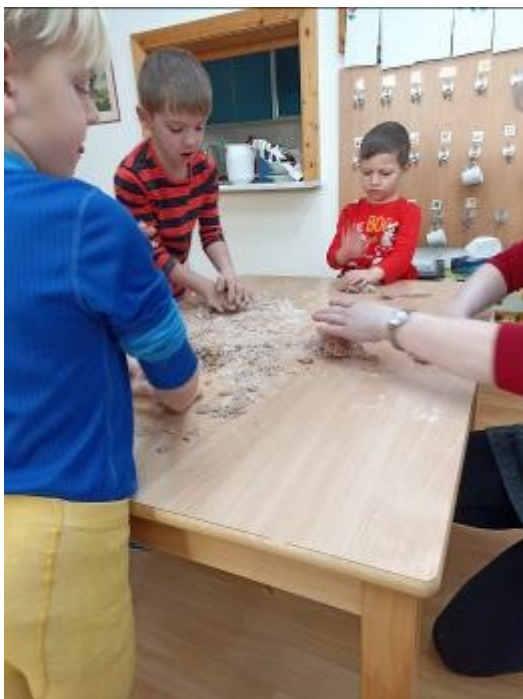
Jednou týdně děti vaří, pečou nebo jinak tvoří s jídlem.

Děti si to po sobě uklidí. Tedy hlavně ty starší, ale ty mladší to vidí a až poporostou, tak se do úklidu také zapojí. Inspiraci hledáme na internetu a na we-