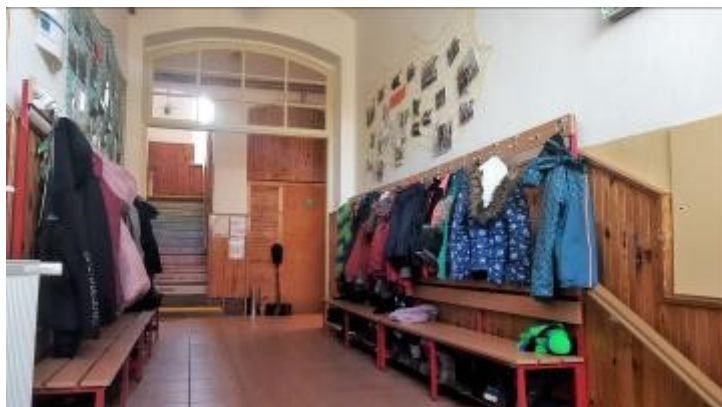
Škola sídlí v budově z 19. století s typicky vysokými stropy.