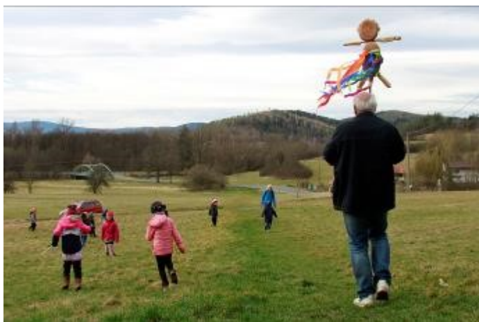
Jedlou, a tedy zcela rozložitelnou Moranu děti vyráběly s učitelkami a manželi Nárovčovými v knihovně.

Ve čtvrtek 23. března 2023 vynesly děti z MŠ Rabí společně se svými učitelkami a manželi Nárovčovými z městské knihovny pečivovitou Moranu. Jeden kulatý a jeden šišatý chléb a čtyři rohlíky—tolik kousků pečiva děti využily na vyrobení symbolické zimy, na které si pak pošmákli obyvatelé Otavy. A děti si za odměnu pochutnaly na buřtech opečených přímo u vody.