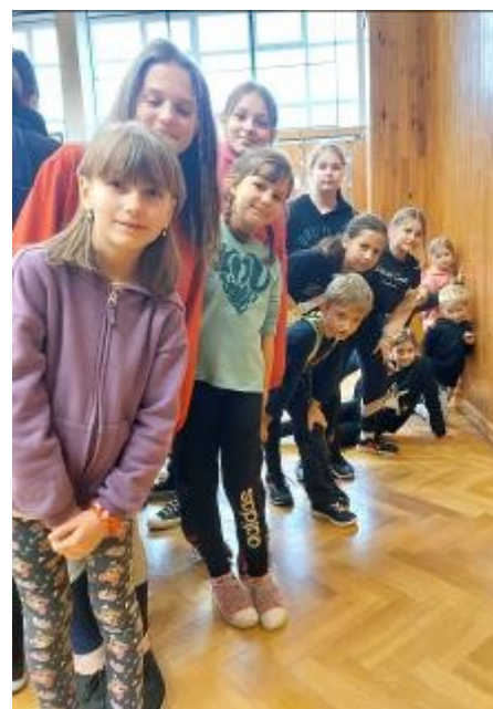
Dětský tým SDH Rabí.

Po splnění všech disciplín následovalo vyhlášení. Celkový výsledek nás starší moc nepotěšil.