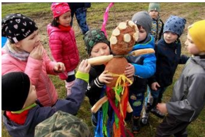
Děti se s Moranou rozloučily po svém. Spontánně jí začaly okusovat a uždíbat.

„Zimo, zimo, táhni pryč, nebo na tě vezmu bič“