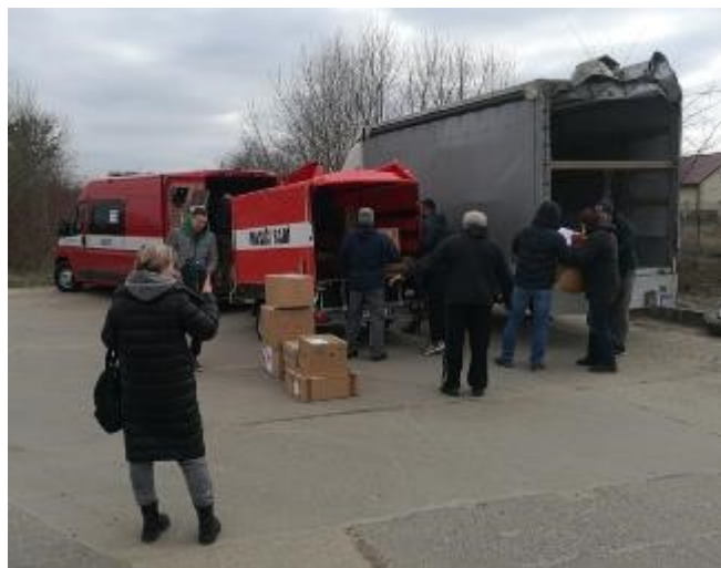
Předání první sbírky ve Lvově.

Třetí elektrocentrála šla ke klukovi, který dělá uzeny. Posílá část výrobku vojákům přes další dobrovolnickou skupinu. Nebo je prodává a peníze posílá vojákům. Na Facebooku uvádí, kolik vydělal a kolik toho posílá na armádu. Má udírnu na elektřinu. Elektřina je vždy čtyři hodiny, a pak čtyři hodiny není. On to za ty čtyři hodiny nestíhá připravit. Elektrocen-