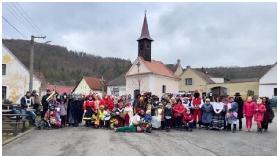
Letos se do masopustního průvodu zapojilo sedmdesát dva masek. Za masky dorazilo i několik čepických rodáků.

V sobotu 18. února 2023 prošel Čepicemi masopustní průvod, kterého se zúčastnil rekordní počet masek. A to i navzdory rozmarům počasí a opravdu vydatnému větru.