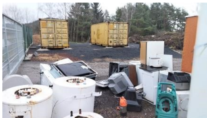
V únoru jsme také do venkovního skladu pořídili dva lodní, které už nyní slouží k uskladnění elektroodpadu.